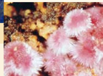
Kobalterz aus Imsbach