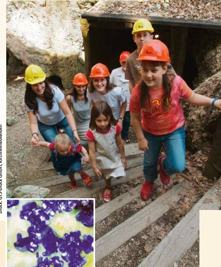
Druck: GTS-Druck GmbH, Kirchheimbolanden