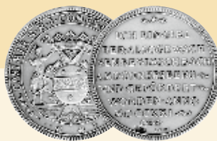
Silbertaler aus Imsbach aus dem Jahre 1721

Bergbauspuren aus den letzten 600 Jahren begegnen dem Besucher bei einem Rundgang durch das ausgedehnte Stollensystem des Besucherbergwerks „Weiße Grube“: Von sauber mit Schlägel und Eisen bearbeiteten Bereichen aus dem Mittelalter bis hin zu den mit Sprengstoff herausgeschossenen Grubenbauen der letzten Bergbauphase zu Beginn des 20. Jahrhunderts. Kupfer-, Silber- und Kobalterz wurde hier in mühsamer Arbeit ans Tageslicht gebracht. In den großen unter- und übertägigen Abbauweitungen lassen in allen Farben leuchtende Minerale den einstigen Erzeichtum der Grube erahnen. Übertage werden Techniken zur Aufbereitung der Erze gezeigt.