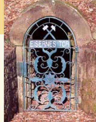
„Eisernes Tor“ - Wahrzeichen des Eisenerzbergbaus

Seit 2006 ist die über 250 Jahre alte und letztmals 1923 betriebene Eisenerzgrube zu begehren. Die Besichtigung ihrer Stollen und Schächte bietet ein eindrucksvolles Bild von der harten Arbeit unter Tage. Die Grube besitzt zwei Ebenen (bergmännisch = „Sohlen“). Der Hauptstollen der unteren Sohle ist etwa 250 Meter lang und dabei völlig gerade, so dass man von seinem hinteren Ende aus noch den Eingang als kleinen hellen Punkt erkennen kann. Hier und in mehreren Seitenstollen erfährt man viel über die erschlossenen Gesteine, die Eisenerzvorkommen und Bergbautechniken. Über einen Schacht mit Wendeltreppe gelangt man zum rund 15 Meter höher liegenden Stollen der oberen Sohle, der in seinem Verlauf enge Stollen aus dem 18. Jahrhundert quert. Nach knapp 100 m wird auf der anderen Seite des Berges wieder das Tageslicht erreicht.