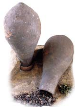
historische Retorten zur Quecksilbergewinnung